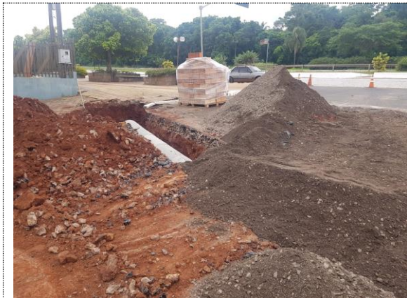
Reaterro de vala.