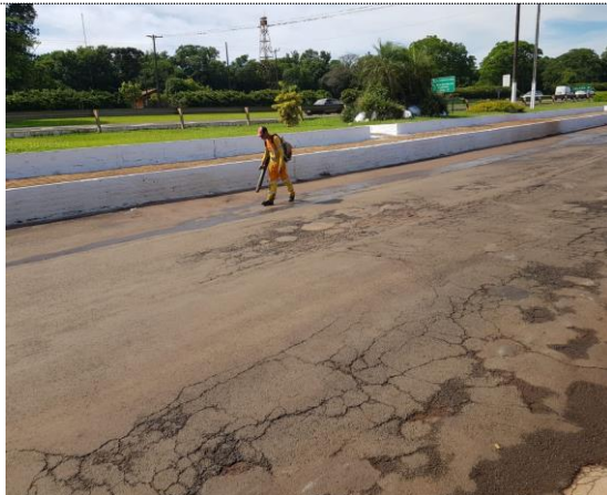
Limpeza e lavagem de pista