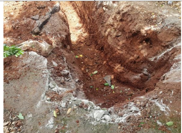
Escavação de vala para boca de lobo.