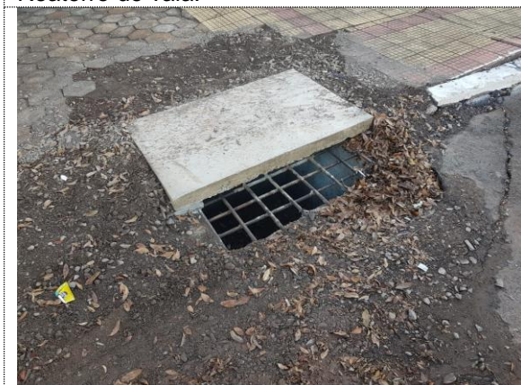
Execução de boca de lobo.