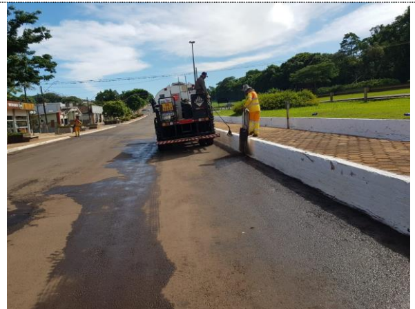
Execução de pintura de ligação