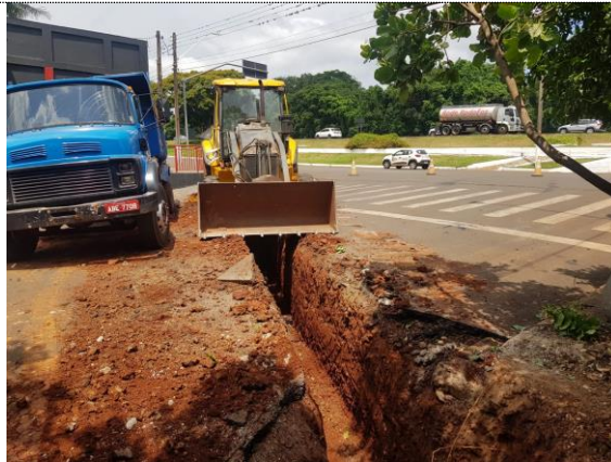
Escavação de vala para galeria pluvial.