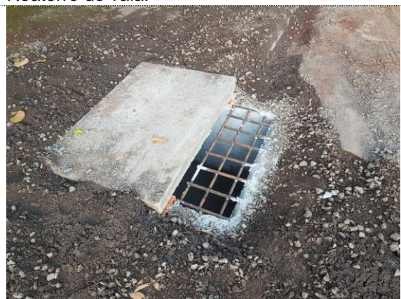
Execução de boca de lobo.