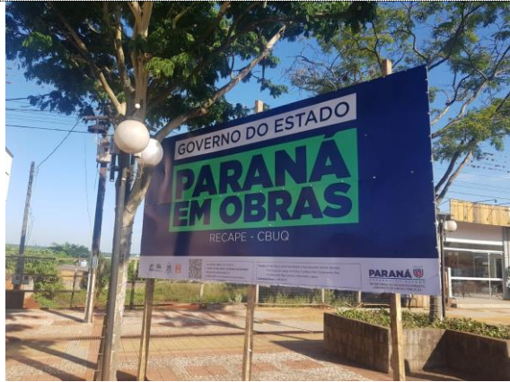
Placa de Obra