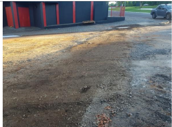
Reaterro de vala.