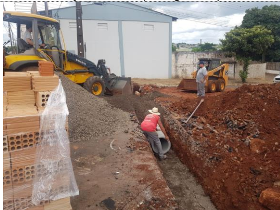
Instalação dos tubos para galeria pluvial.