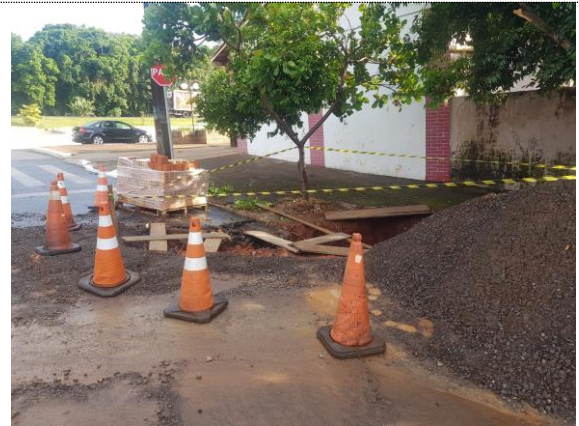
Escavação de vala para boca de lobo.